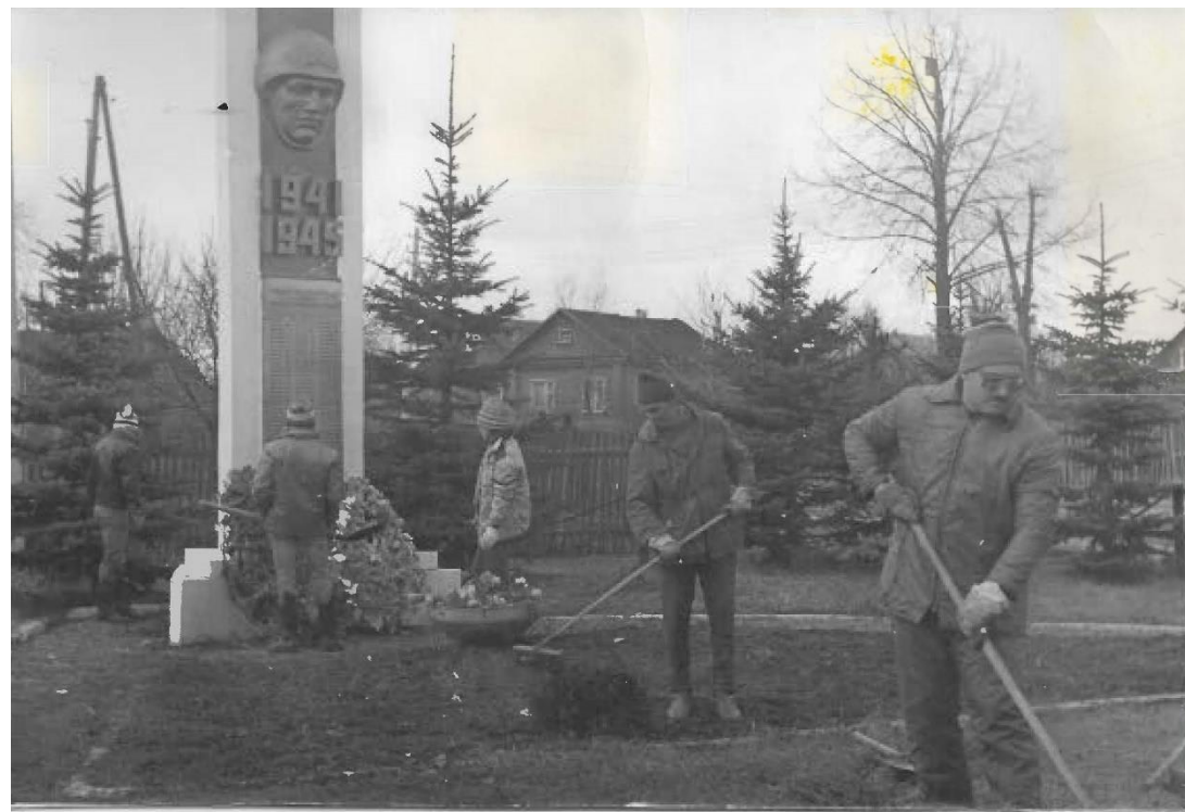
1982-1985гг. Субботник у памятника с участием местных жителей и членов Горнолыжного Клуба "Метеор".

В результате этого труда расшифрованы инициалы 112 погибших фронтовиков и установлены имена еще 27 человек. На этом основании к 70летию со Дня великой Победы – 30 апреля 2015г. были установлены 4 стелы с именами погибших.