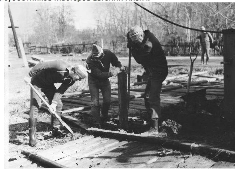
Субботник на территории Мемориального Поля у Памятника Погибшим в Великой Отечественной Войне, ул.Советская